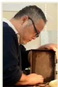
津軽塗 (箸・匙つや出し) 今年人