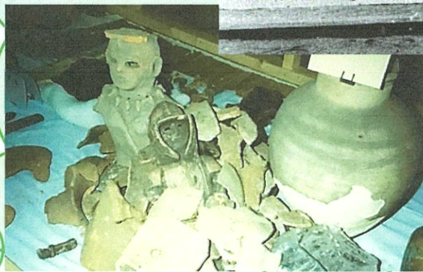
おせどう墳先祖改め遺物 (石塔山蔵:藤本光幸写真帳)