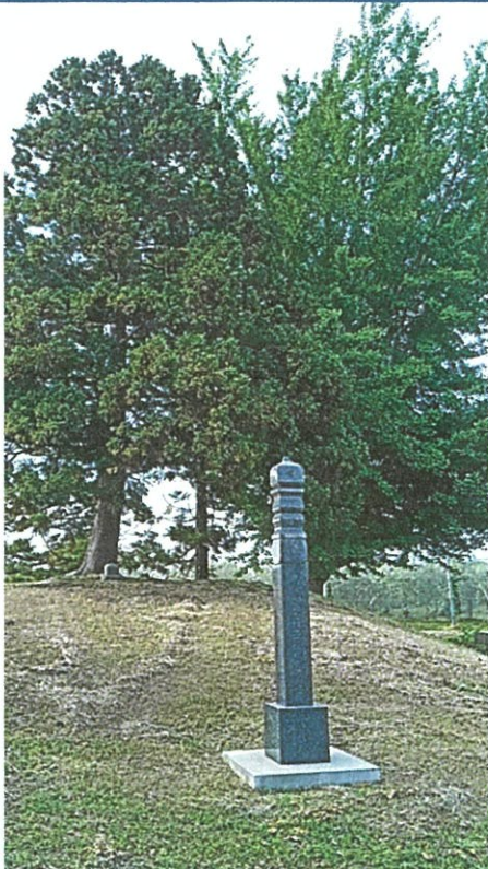
沢田杜(板柳町) :安日彦大王の初期墳墓か!